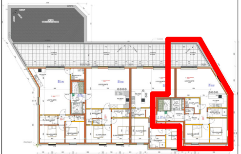
App.7 (1ste. Verdieping)